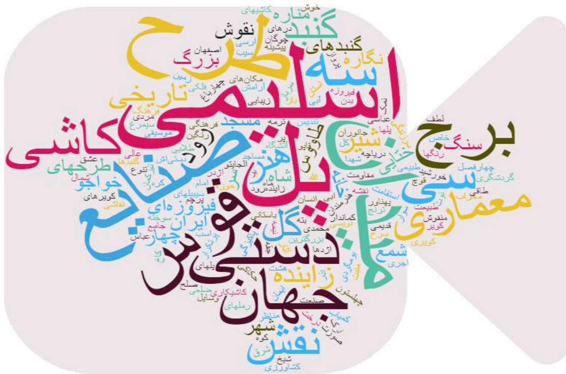
شکل ۴- ابر کلمات مربوط به اصفهان در قالب یک نماد