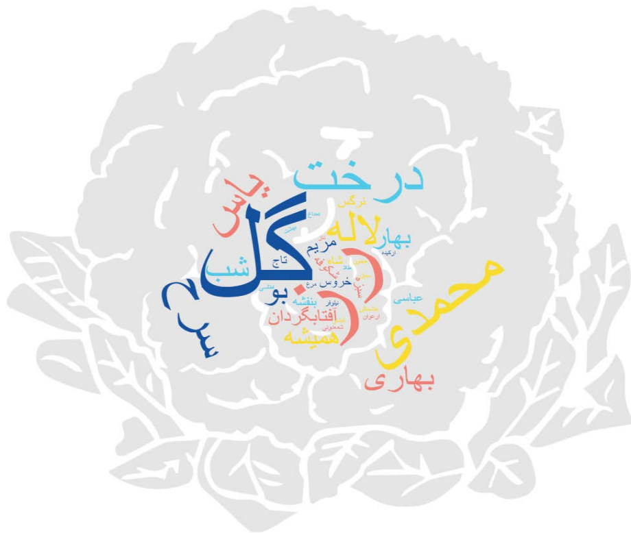
شکل ۵- ابر کلمات مربوط به تصویر اصفهان در قالب گل